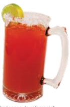
Imágenes de referencia*